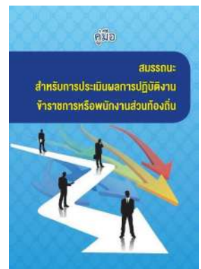
หนังสือ สมรรถนะสำหรับการประเมินผลการปฏิบัติงาน ข้าราชการหรือพนักงานส่วนท้องถิ่น