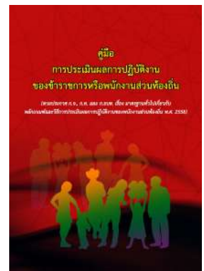
หนังสือ การประเมินผลการปฏิบัติงาน ของข้าราชการหรือพนักงานส่วนท้องถิ่น