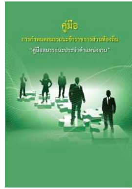
หนังสือ สมรรถะประจำตำแหน่งงาน