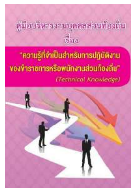
หนังสือ ความรู้ที่จำเป็นสำหรับการปฏิบัติงาน ของข้าราชการหรือพนักงานส่วนท้องถิ่น (Technical Knowledge)