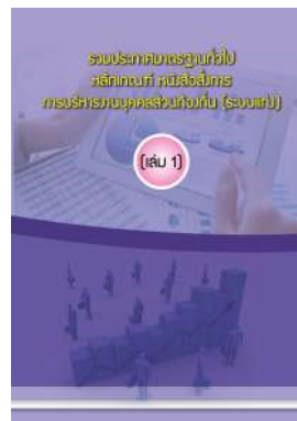
หนังสือ รวมประกาศมาตรฐานทั่วไป หลักเกณฑ์ หนังสือสั่งการ การบริหารงานบุคคลส่วนท้องถิ่น